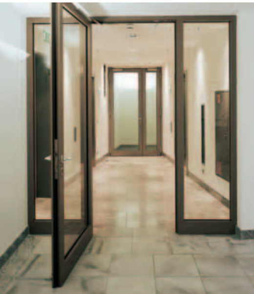
Schüco Firestop II EI60 Puerta con elementos laterales fijos Door with sidelights