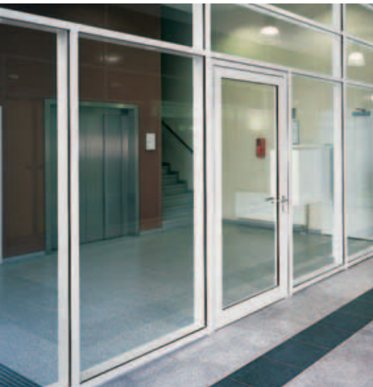
Schüco Firestop T90 / F90 Puerta / cerramiento vidriado cortafuego Fire door / fire-resistant wall unit